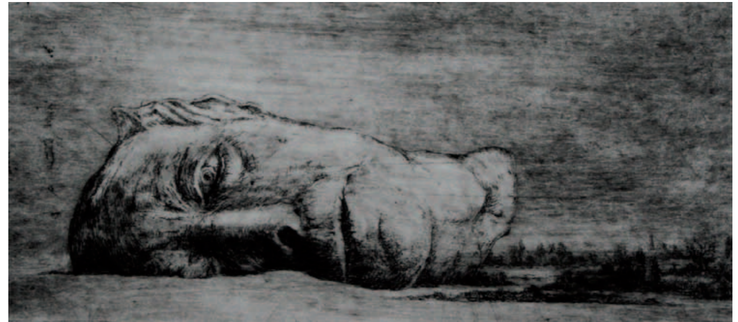
Soort liggend hoofd